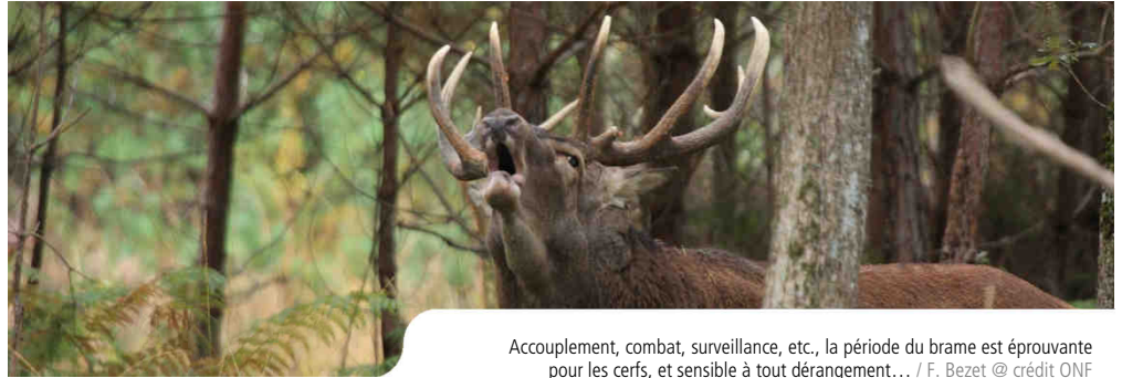
Accouplement, combat, surveillance, etc., la période du brame est éprouvante pour les cerfs, et sensible à tout dérangement...

De septembre et mi-octobre, un cri profond résonne en forêt... Il s'agit du brame du cerf qui annonce la saison des amours.